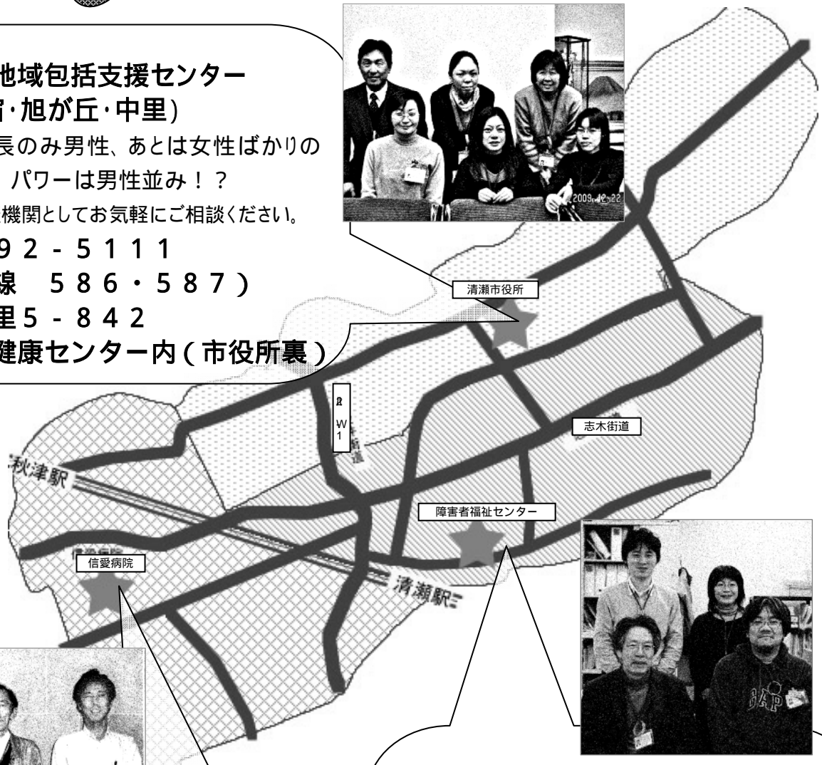
障害者福祉センター