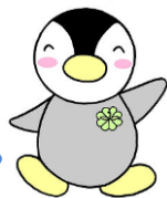
東京都民生・児童委員 キャラクター ミンジー