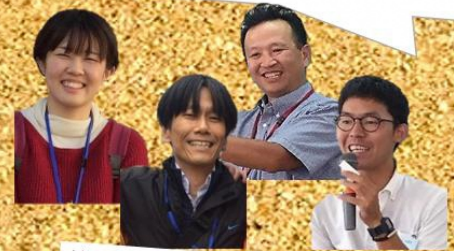
清瀬市生活支援コーディネーター

地域の集まりなどで、このマスクを配布したい とのご要望があればお渡しすることができます。 清瀬市社会福祉協議会までご連絡ください！ ☎ 042-495-5333