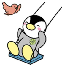
東京都民生児童委員連合会 キャラクター「ミンジー」

新型コロナウイルス感染拡大によって、皆さまの生活にさまざまな影響が出てきています。民生・児童委員には守秘義務があり、相談の内容などの秘密は固く守られますので、お気軽にご相談ください。内容に応じて市などの関係機関を案内し、必要な福祉サービスをご紹介します。