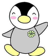
東京都民生児童委員連合会 キャラクター「ミンジー」