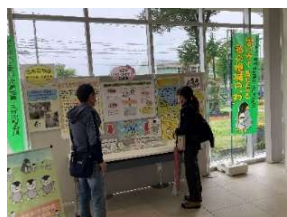
パネル展示の様子

地域の皆様にもっと知っていただけたらと思います。民生・児童委員には守秘義務があり、相談の内容などの秘密は固く守られますので、安心して、ご相談ください。