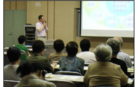
6月29日(水)アミューホールにて

高齢者の尊厳を守りながら、介護する家族の負担を減らすにはどんな方法があるのでしょうか?虐待等の心配なケースについては、地域包括支援センターが相談に応じています。早期発見、通報や相談も市民の皆さんの重要な役割です。