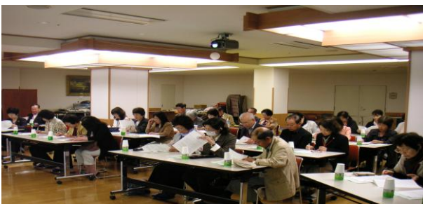
「社会福祉法人桜ヶ丘社会事業協会見学の様子」

この法人は、昭和6年に東京市の方面委員(現在の民生・児童委員)が設立した財団を母体としています。新任委員のみならず、民生・児童委員の日常の活動に大変参考になりました。