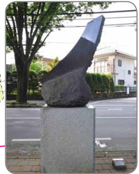
そりのあるかたち '90

けやき通り道端に、国内外の著名な作家の彫刻を配した「ケヤキ ロード ギャラリー」の作品の一つ（設置＝平成2年）