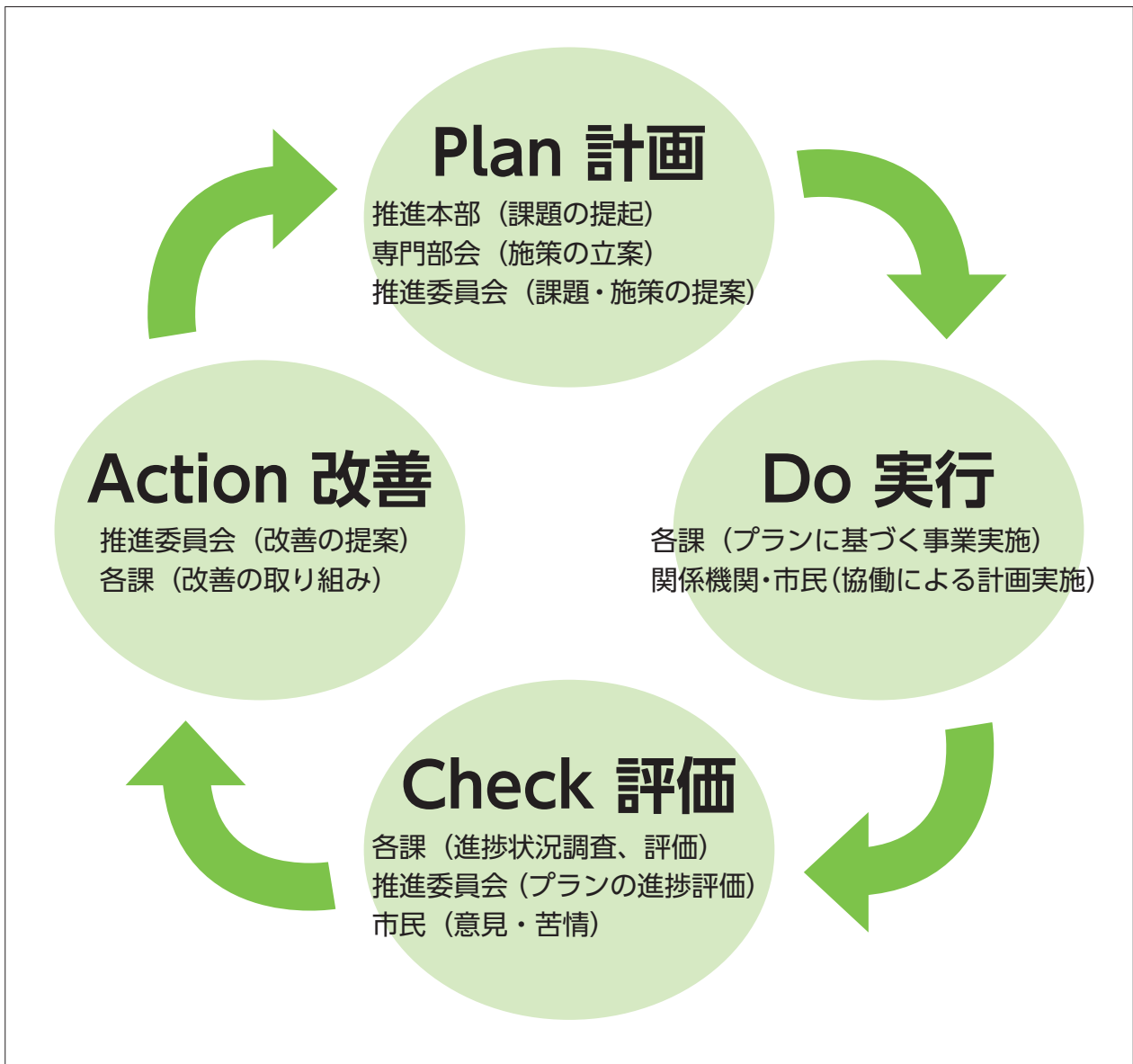
図Ⅳ-1 庁内推進体制のPDCA