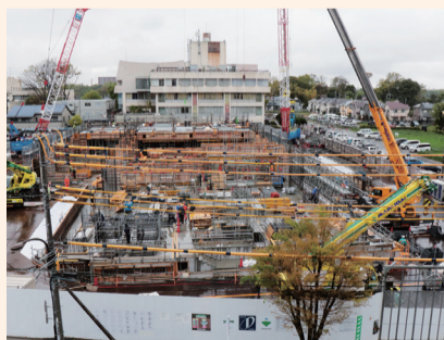
工事全体写真(4月20日時点)