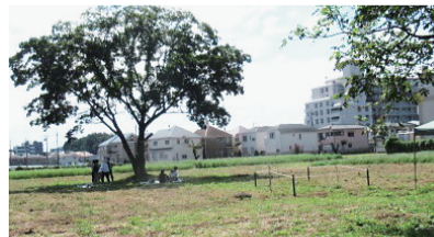
当日は暑かったため、木陰は休憩スポットで人気でした