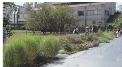
多年草ガーデンではこれからコキアの紅葉が楽しめます