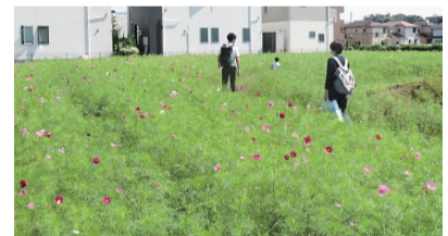
コスモス畑は10月中旬以降に満開になる予定です