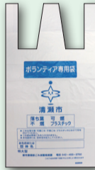
ボランティア専用袋

【出し方】①=集めたごみは可燃ごみと不燃ごみに分け、それぞれの項目に○をして収集日に出してください。②=落ち葉のみの場合は「落ち葉」に○をし、ごみ減量推進課へお申込みください。ごみなどの混入物を分けていない場合は、可燃ごみに○をし、月曜日と木曜日に可燃ごみとして排出してください。