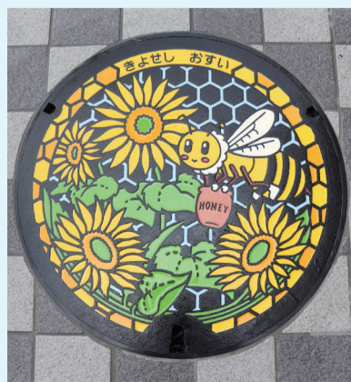
設置したデザインマンホール蓋

デザインマンホール蓋を巡る観光振興が全国的に話題を集めていることから、市ではシティプロモーションの取組みとして、東京都と連携してデザインマンホール蓋の制作と設置を行いました。また、下水道への理解と関心を深めていただくため、今回制作したデザインマンホール蓋のマンホールカードを令和3年秋以降に配布を予定しています。詳細が決まり次第、お知らせします。☎下水道課施設設計係 ☎042-497-2532