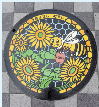
設置したデザインマンホール蓋

デザインマンホール蓋を巡る観光振興が全国的に話題を集めていることから、市ではシティプロモーションの取組みとして、東京都と連携してデザインマンホール蓋の制作と設置を行いました。また、下水道への理解と関心を深めていただくため、今回制作したデザインマンホール蓋のマンホールカードを令和3年秋以降に配布を予定しています。詳細が決まり次第、お知らせします。☎下水道課施設設計係 ☎042-497-2532