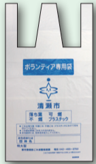
ボランティア専用袋

【出し方】①=集めたごみは可燃ごみと不燃ごみに分け、それぞれの項目に○をして収集日に出してください。②=落ち葉のみの場合は「落ち葉」に○をし、ごみ減量推進課へお申込みください。ごみなどの混入物を分けていない場合は、可燃ごみに○をし、月曜日と木曜日に可燃ごみとして排出してください。