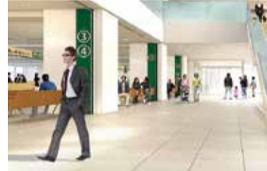
新庁舎1階イメージ

敷地内及び建物内は段差のない構造とし、廊下は車いす利用者でもすれ違うことのできる幅を確保します。