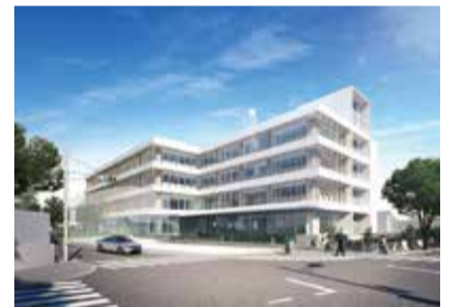
新庁舎完成イメージ

高齢支援課や地域包括ケア推進課を本庁舎1階に移動し、福祉の手続きがワンフロアでできるようにします。