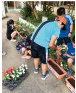
人権の花を植える六小の児童たち