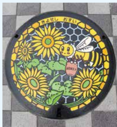
設置したデザインマンホール蓋

デザインマンホール蓋を巡る観光振興が全国的に話題を集めていることから、市ではシティブロモーションの取組みとして、東京都と連携してデザインマンホール蓋の制作と設置を行いました。また、下水道への理解と関心を深めていただくため、今回制作したデザインマンホール蓋のマンホールカードを令和3年秋以降に配布を予定しています。詳細が決まり次第、お知らせします。☎下水道課施設設計係 ☎042-497-2532