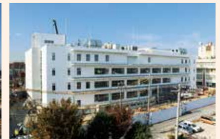
着々と工事が進んでいる新庁舎(11月16日撮影)