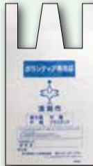
ボランティア専用袋

【出し方】①=集めたごみは可燃ごみと不燃ごみに分け、それぞれの項目に○をして収集日に出してください。②=落ち葉のみの場合は「落ち葉」に○をし、ごみ減量推進課へお申込みください。ごみなどの混入物を分けていない場合は、可燃ごみに○をし、月曜日と木曜日に可燃ごみとして排出してください。