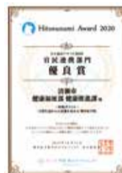
ひと涼みアワードの賞状

今年度は『日常生活からの意識を高める熱中症予防』をテーマに、関係団体などにご協力いただき、熱中症アドバイザー85人が誕生しました。今後は、身近な存在である熱中症アドバイザーと共に熱中症予防に取り組んでまいります。