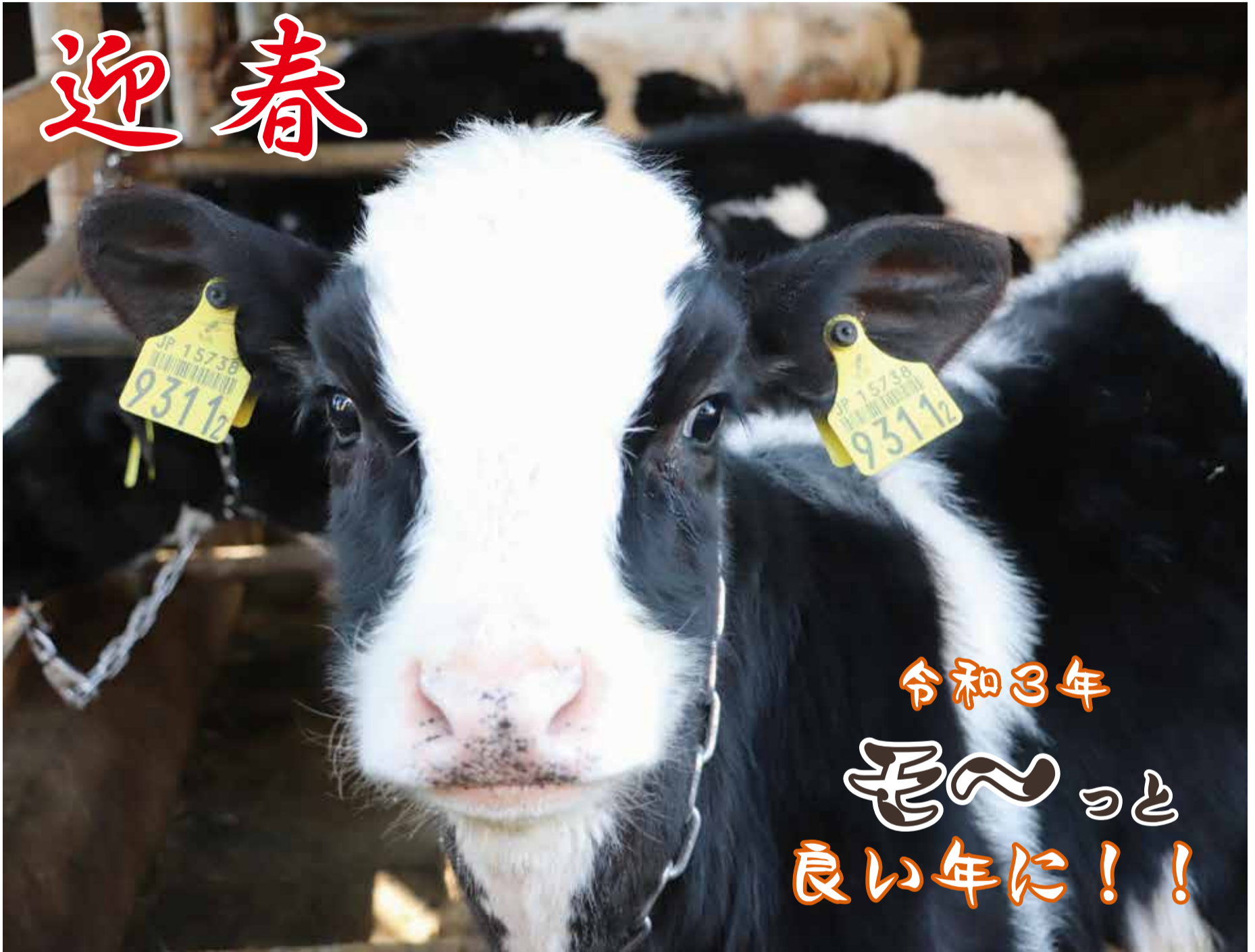
今年の主役が清瀬にも！ 野島ファーム(上清戸二丁目)の仔牛

今号の主な内容▶2面：ごみ減量推進課からのお知らせ：年始の市役所などの業務日程／4・5面：新春特別インタビュー企画 文化勲章受章・清瀬市名誉市民 澄川喜一