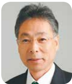
清瀬市長 渋谷 金太郎