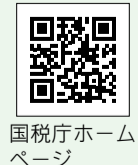
国税庁ホームページ

※ID・パスワード方式は事前に税務署でIDとパスワードを発行する必要があります。運転免許証などの身元確認書類を持参し、お近くの税務署でお手続きください。