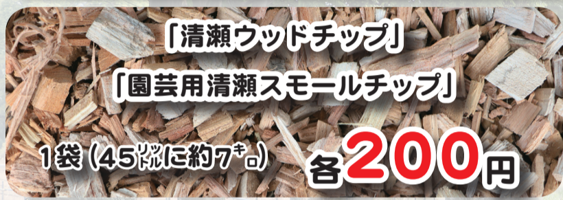
「清瀬ウッドチップ」

ますので、お早めにご予約ください。なお、市内在住の方には、5袋以上の購入で自宅にお届けするサービスも行っています。ぜひご利用ください。☎建築管財課管財係☎042-497-1841