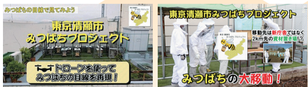
配信中の動画(一部)のサムネイル

現在、約750人の会員がいる「東京清瀬市みつばちプロジェクトオリジナル会員」を随時募集しています。☑プロジェクトの趣旨「自然を豊かにするみつばちと共に清瀬の環境保全活動を推進していく」に賛同していただける方ならどなたでも☑入会金・年会費無料