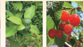
市役所に植栽しているシークワサーとサクランボ