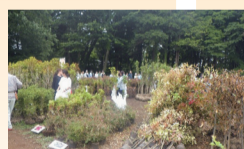
苗木の無料配布の様子

現在、約750人の会員がいる「東京清瀬市みつばちプロジェクトオリジナル会員」を随時募集しています。☑プロジェクトの趣旨「自然を豊かにするみつばちと共に清瀬の環境保全活動を推進していく」に賛同していただける方ならどなたでも☑入会金・年会費無料