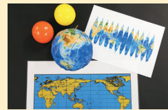
MY地球儀をつくろう