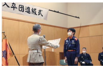
新井少年団長(左)による表彰状授与の様子

防火防災力向上のため、新井消防少年団長を中心に活動していきます。皆さんの応援よろしく申し上げます。