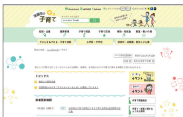
市ホームページ(子育てトップページ)