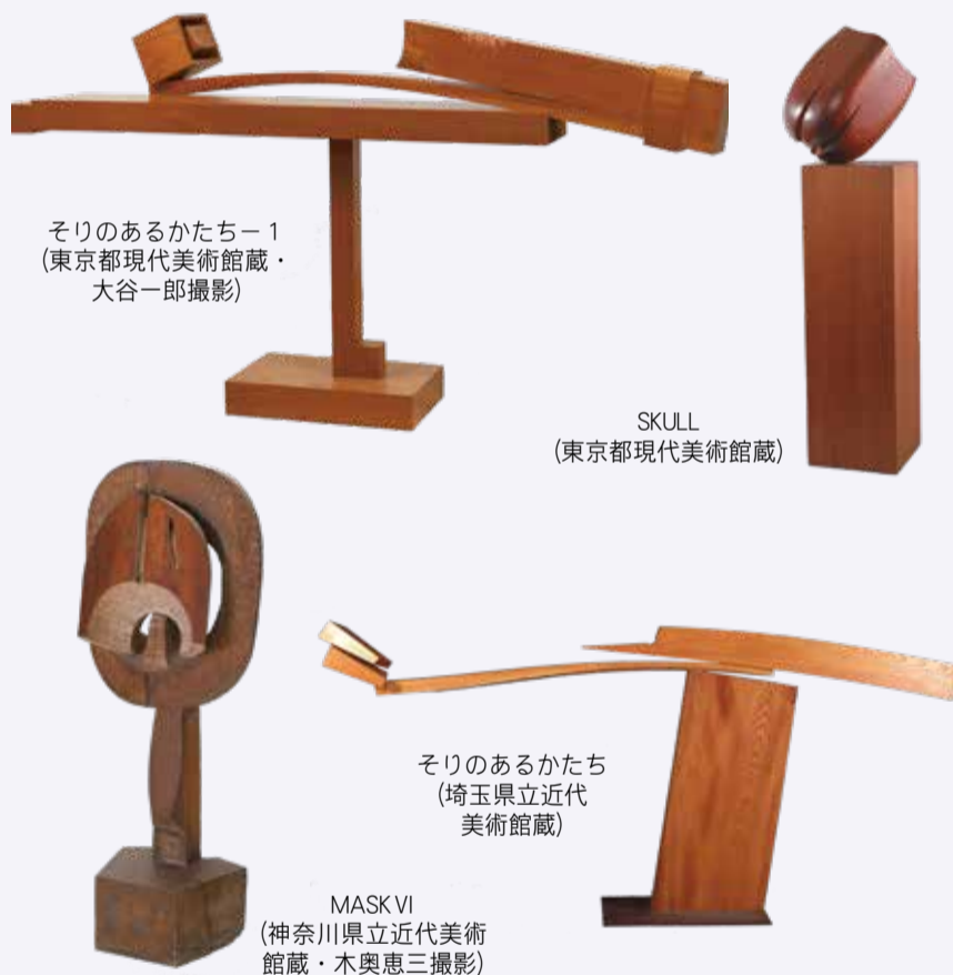
そりのあるかたち-1 (東京都現代美術館蔵)

申問いずれも6月15日午前9時から電話で郷土博物館 ☎042-493-8585 へ