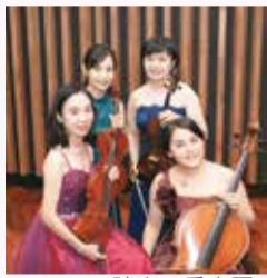
マルシェ弦楽四重奏団

午後3時20分～4時(午後2時50分開場)(各回同一内容) 場アミューホール【演奏】マルシェ弦楽四重奏団【曲目】ドビュッシー弦楽四重奏曲、民謡「ソーラン節」他 6月15日(日)午前9時から電話で生涯学習スポーツ課生涯学習係 ☎042-497-1815へ