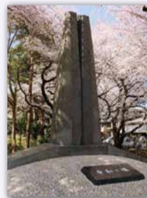
「平和の塔」 中央公園