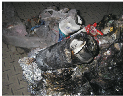
スプレー缶が爆発して火災が起きたごみ

皆さまの正しいごみの分別排出が、火災や爆発事故を防ぐこととなりますので、ご理解・ご協力をお願いします。☎環境課ごみ減量推進係 ☎042-493-3750