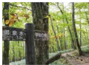
ウォーキングコースの様子

学生=8,740円(1泊4食) ※支払いは現金のみ。 ※別途夕食時の飲み物代。 申 9月1日午前9時から直接または電話で生涯学習スポーツ課生涯学習係☎042-497-1815(平日のみ、午後5時まで)へ