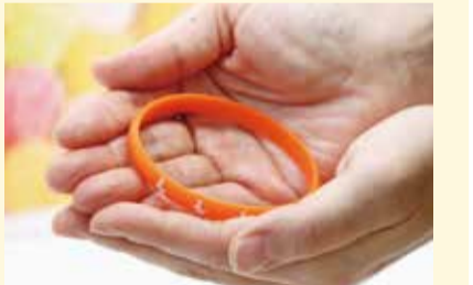
認知症サポーターの証であるオレンジリング

認知症は誰にでも起こりうる疾患です。認知症の方やその家族が安心して住み慣れた地域で暮らしていけるように、認知症への理解を深めましょう。 【清瀬市での取り組み】 啓発ポスターなどの掲示、庁内での啓発コーナー展示、「ケアニンこころに咲く花」の映画上映(本面「催し・イベント」欄参照。9月4日開催)、認知症サポーター養成講座(9月9日開催)、認知症家族会ゆりの会での認知症サポート医との交流(本面「健康・福祉」欄参照。9月16日開催) 介護保険課地域包括ケア係 ☎042-497-2082