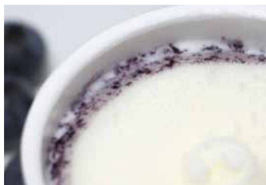
ブルーベリーソースがアーモンドミルクのジェラートを包み込む

ブルーベリーは目の疲れをやわらげてくれる成分(アントシアニン)があって、アーモンドもビタミンEや食物繊維などが豊富ということで、昨今健康成分が注目されているじゃないですか。ですから、健康志向で、でもジェラートを楽しみたいという方にもおすすめできます。