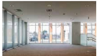
市民協働サロン兼ギャラリー

市役所2階の市民協働サロン兼ギャラリーについて、下記のとおり貸出を開始しました。催し物会場や展示スペースとしてご利用いただけます。ご利用を希望される方は、総務課総務統計係窓口までお越しください。【利用料金】無料(展示用パネルなどをご利用の場合は別途貸付料あり) 【利用時間】年末年始を除く毎日。午前8時30分～午後5時 問 総務課総務統計係 ☎042-497-1819