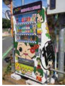
郷土博物館裏門駐車場に設置された自動販売機(デザインは博物館職員によるもの)

す。なお今回の設置は、清瀬市とコカ・コーラ ボトラーズジャパン株式会社が5月31日に締結した地域活性化包括連携協定に基づくものです。☎企画課企画調整担当 ☎042-497-1802