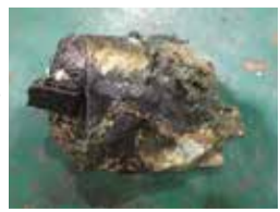
発火した電子部品

☎環境課ごみ減量推進係清掃事務所(下宿二丁目553) ☎042-493-3750