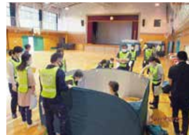
避難所でのテント設営訓練

※駐車場はありません。自転車または公共交通機関をご利用ください。駐輪場は三小の正門付近に設置します。