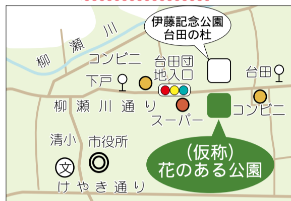
◆アクセス...清瀬駅北口より「志木駅」行きまたは「台田団地」行きに乗車し、「下戸」バス停下車、徒歩約3分