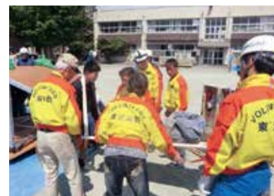
救出救助体験訓練