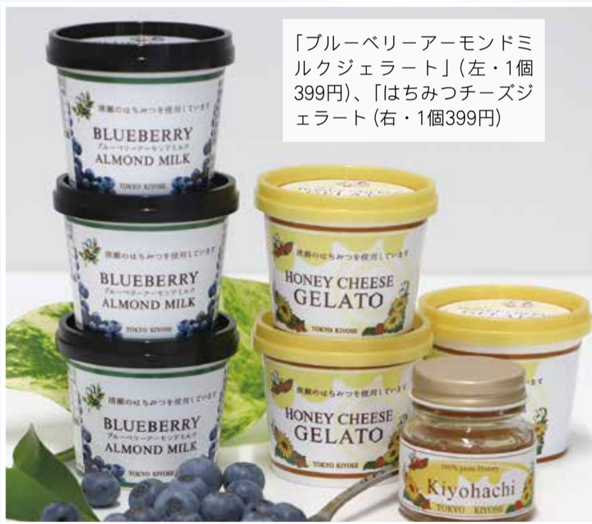
「ブルーベリーアーモンドミルクジェラート」(左・1個399円)、「はちみつチーズジェラート」(右・1個399円)

ジェラテリア・パンチェーラ監修 ブルーベリーアーモンドミルクジェラート はちみつチーズジェラート