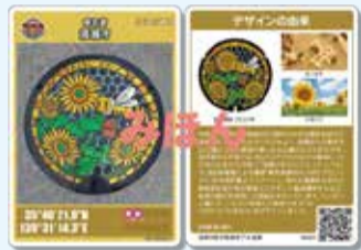
配布しているマンホールカード