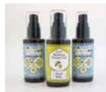
ハニーGEL、アルコールジェルセット