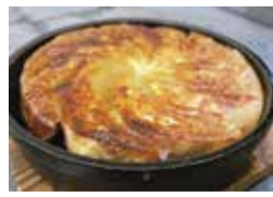
冷凍餃子(写真は調理済みのもの)