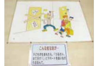
展示されるパネル

日12月6日(月)～10日(金)午前8時30分～午後5時 場市役所 市民協働サロン兼ギャラリー☎秘書広報課広報広聴係 ☎042-497-1808