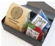
エコなたわしと石けんセット