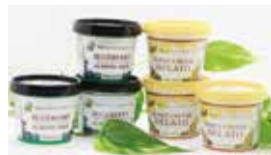
ジェラート2種セット

今回拡充した返礼品は、ジェラートの「きよはちを使用したジェラート2種セット」、happy creations Queの「エコなたわしと石けんセット」、餃子のたかはしの「姫餃子」、「しそ餃子」、「生姜餃子」、ソーシンの「きよはちを使用したハニーGEL、アルコールジェルセット」の6点です。☎産業振興課産業振興係 ☎042-497-2052