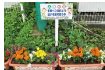
芝山小の人権の花