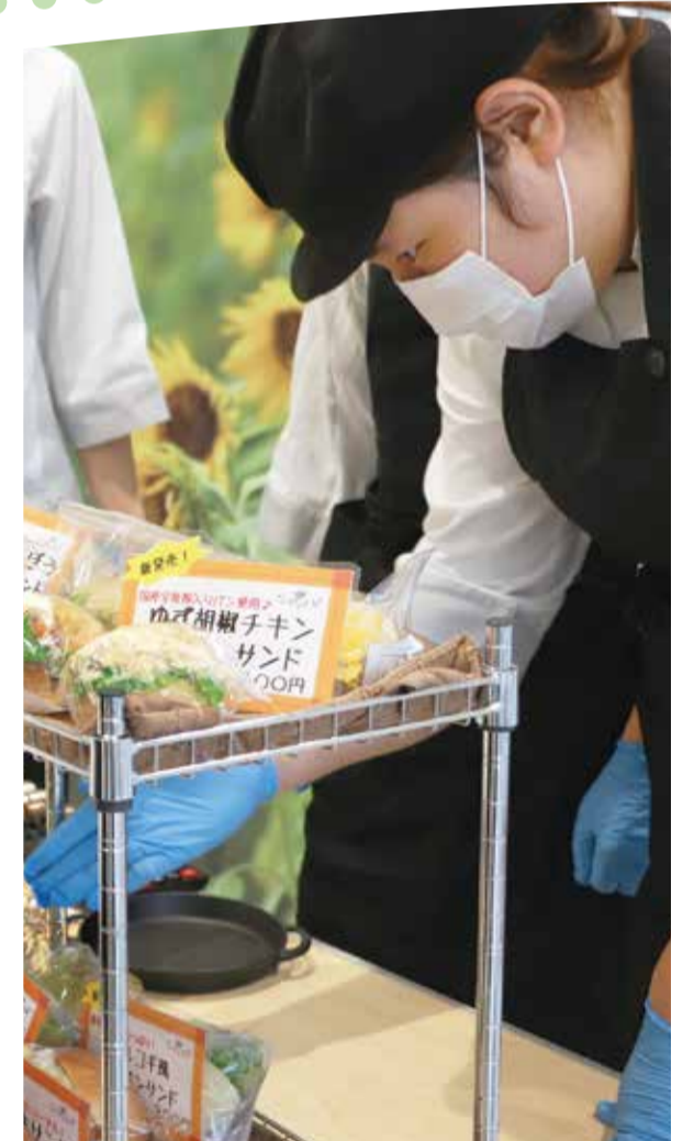
表紙：市役所での市内社会福祉事業者（ベーカリーショップどんぐり、Cafe ふわっとん）によるパン販売の様子