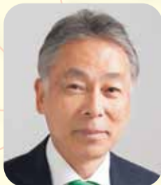
清瀬市長 渋谷 金太郎

今年は無年です。市民の皆さま一人一人が充実した生活を送れるまちを、虎視眈々と目指してまいります。今年もよろしくお祝い申し上げます。