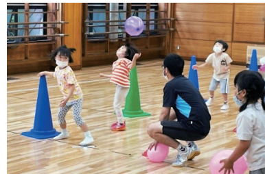
バルシューレ教室