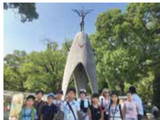
令和元年度の様子

ください)では、平和祈念展等実行委員会と本派遣で平和に関する対談を行う予定です。ぜひご来場ください。☎生涯学習スポーツ課生涯学習係 ☎042-497-1815