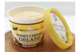
はちみつチーズジェラート