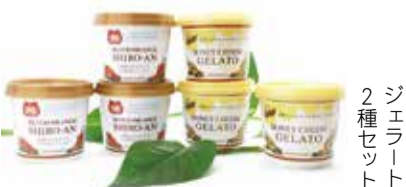
2種ジェラートセット