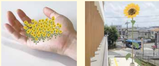
※写真のひまわりは実在しません。