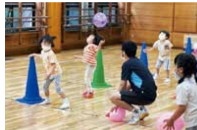
バルシューレ教室