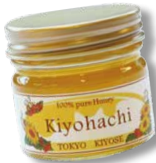
市役所産はちみつ「Kiyohachi」(50g ㍴ ) 500円(税込み)