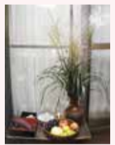
清瀬で行われていた十五夜の様子

十五夜・十三夜のお供え物を再現した展示をとおり、行事の説明や清瀬で行われていた十五夜の様子を紹介します。☎9月14日(水)～10月14日(金) 場直問 郷土博物館 ☎042-493-8585