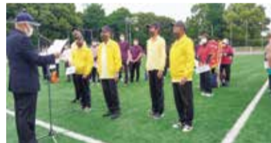
第75回都民体育大会(男子)

多摩市立陸上競技場(多摩市諏訪四丁目)にて開催された「第54回東京都市町村総合体育大会」でも、混成の部で見事準優勝されました。今後も活躍が期待されます。