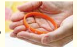
認知症サポーターの証 オレンジリング

「もの忘れ相談プログラム」を使ったもの忘れチェックと地域包括支援センター職員の相談などが受けられます。 日9月20日(火)・21日(水)午前10時～午後3時 場市役所本庁舎市民交流スペース 費無料