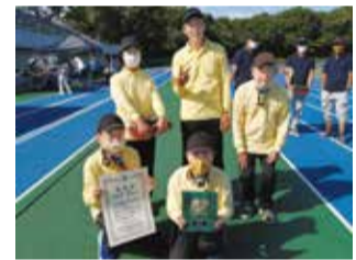
第54回東京都市町村総合体育大会(混成)