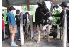
立科町での乳しぼり体験 (SDGsについて考える)

学校支援本部、保護者の会、地域の方々と連携した活動を実施(子どもたちの興味関心を高め、学ぶ意欲を向上させるため、漢字検定、サタデースクールなどを共同で運営)