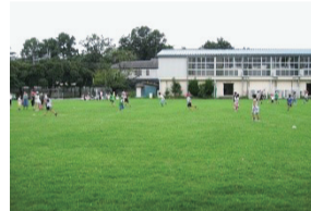
ふれあい班活動 (異学年交流活動)