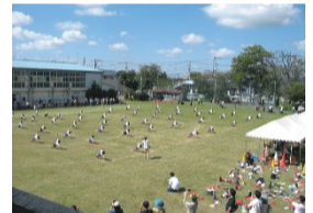
運動会 (運動に親しむ活動)