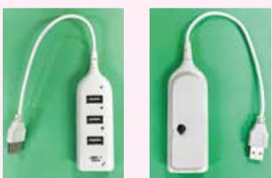
焼損したUSBハブ(表) 焼損したUSBハブ(裏)

事例のような製品についての相談を受けた際、原因究明の必要性があると判断した場合は、メーカーなどに調査を依頼しています。そして、調査の結果、原因がその製品にあるとわかった場合は再発防止策の検討を促します。