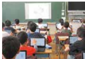
タブレット端末の活用