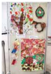
昨年の様子(市役所本庁舎での展示)