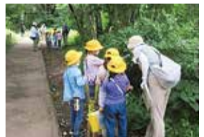
自然観察会(ゲストティーチャー)