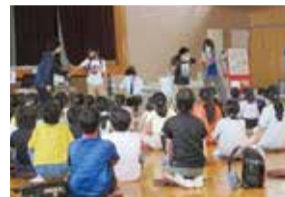
体験型安全教育(不審者対応)