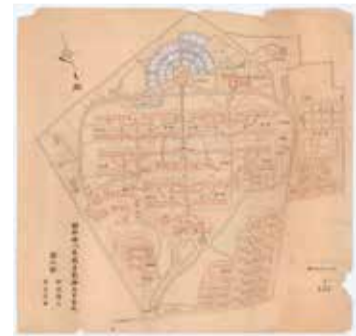
傷痍軍人東京療養所病棟配置図

当時、他の公私立の療養所では入院までに時間を経たゆえの重症患者が多かったのに比べ、傷痍軍人結核療養所は規模も大きく比較