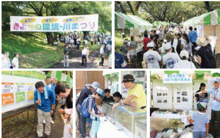
前回(令和元年)の様子