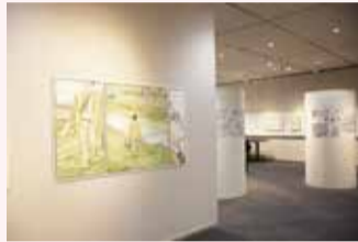
会場の様子(1月20日撮影)