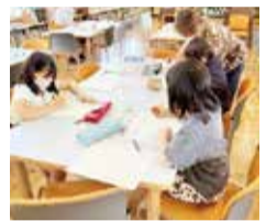
パワーアップタイム