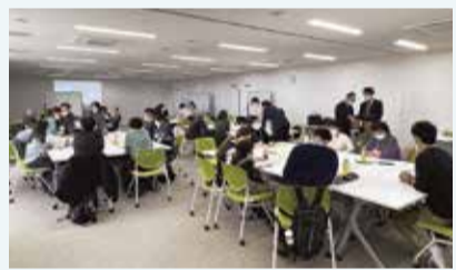
前回のワークショップの様子