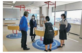
公益財団法人 日本海事広報協会と連携した職場体験