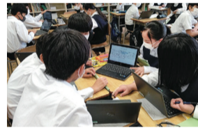
タブレット端末を活用した学習