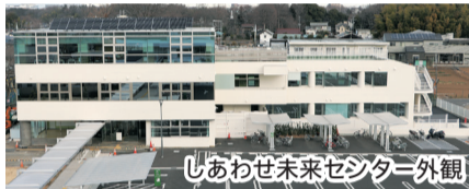
しあわせ未来センター外観

子育て世代包括支援センター、2階には子ども家庭支援センター、教育支援センター、教育相談室が入り、お子様に関するさまざまな相談窓口を集約し、妊娠から子育てまでの切れ目のない支援を行います。