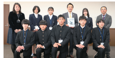
清中の皆さんと澁谷市長

このプロジェクトは、新型コロナウイルス感染症の影響で、令和2・3年度の中学校スキー教室を実施できなかった現在の中学2・3年生を対象に、生徒たちが企画