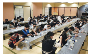
通常の学級と特別支援学級が共同で学ぶ学校行事