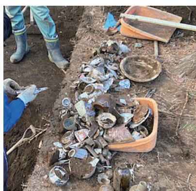
調査の過程で見つかったもの(一部)