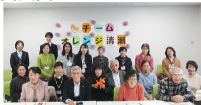
チームオレンジ清瀬 の皆さん