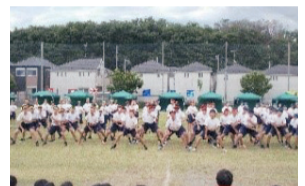
国際交流・理解「ハカ」