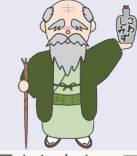
市史編さん室キャラクター 市史館(ししじい)