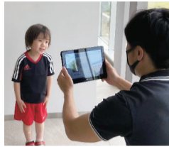
職員による写真撮影の様子

【注意事項】 必ずご本人が来庁してください。その場で顔写真を撮影するため、代理人による申請はできません。15歳未満の方は法定代理人(保護者)と一緒にお願いします。カードの交付には申請から1か月半～2か月程度かかります。プレミアム付デジタル商品券(詳しくは右上の記事参照)を申請予定の方は早めに申請してください。 問市民課住民係 ☎042-497-2037