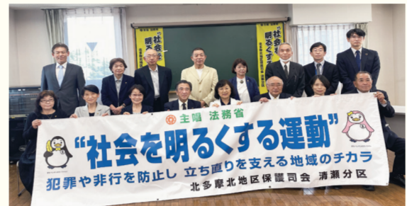
犯罪や非行をした人のなかには、ひとりではどうにもならない“生きづらさ”を抱えている人たちがいます。その一人ひとりを受け入

【出演】よさこいソーラン清瀬、きよせけん玉のWa、清瀬中学校・清瀬第五中学校吹奏楽部