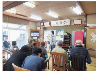
いずれも出前講座の様子