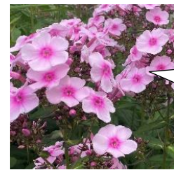
宿根フロックス (花魁草)