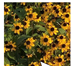
ルドベキア・ ブラックジャック ゴールド

切り戻しを しましたが、 札を立てて、 みなさんのお越 しをお待ちして います。