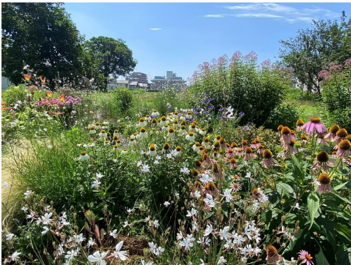
2023年7月のナチュラルガーデンの風景

エキナセア ユーパトリウム・レッドドwarf ガウラ クリスマスローズ キャットミント ミューレンベルギア スティパ・テヌイシマ ベアグラス キキョウ パンパスグラス (ドwarf) ルドベキア・ブラックジャックゴールドなどがあります。