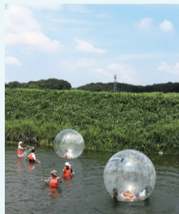
川のイベント(2019年の様子)

清瀬市の豊かな自然と身近な環境を守り、次世代に引き継いでいくためのイベント「2023きよせの環境・川まつり」を、4年ぶりに開催します。環境問題に関する取組みなどの展示、食品販売、ゲームコーナー、川遊びなどが行われ、清瀬が誇る自然を楽しめるイベントです。「環境保全の主役は私たち」であることを、来て・見て・体験してください。 ☎きよせの環境・川まつり実行委員会事務局(環境課環境政策係)☎042-497-2099