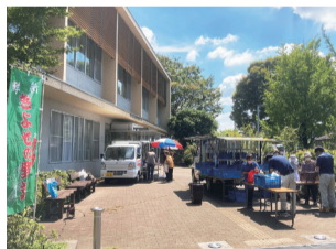
買い物支援と地産地消促進のための移動販売

○農政係…清瀬市の農業を守りながら、農家が真正面から向き合ってきた生産してきた農産物の魅力を発信し、「畑とともにあるまち清瀬」を未来に継承していくことが使命です。 ○商工係…商工業者が主役! を旨として、事業者の事業継続と、まちの賑わいづくりを支援するのが使命です。