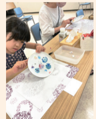
ポーセラーツ教室

※各コンテンツの実施時間・対象年齢・定員など詳しくは、特設サイトを確認していただくか、上記へお問い合わせください。「★」は新コンテンツです。