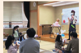
バルーンアート教室