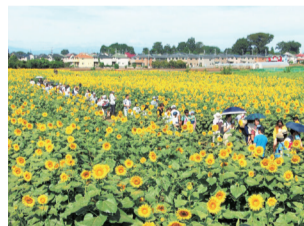
清瀬ひまわりフェスティバル