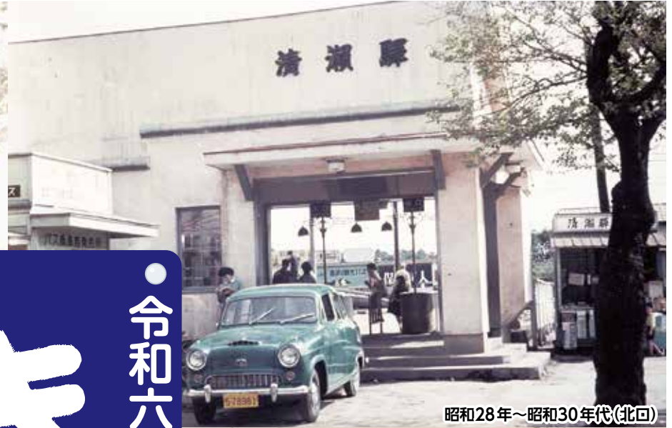
昭和28年～昭和30年代(北口)