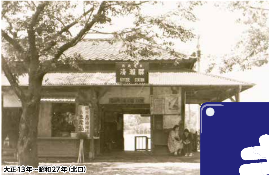
大正13年～昭和27年(北口)

発行：清瀬市 編集：経営政策部シティプロモーション課 〒204-8511 清瀬市中里五丁目842 ☎ 042-492-5111 (代表) FAX 042-492-2415 メール：kouhou@city.kiyose.lg.jp