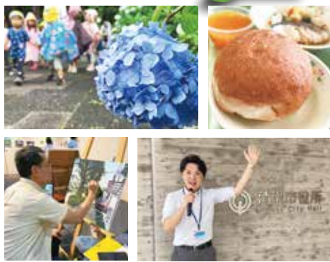
シティプロモーション課職員が撮影・編集を行っています