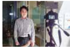
※職員採用試験動画の撮影の様子