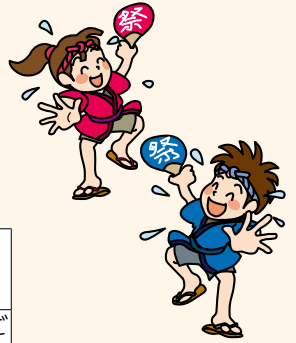
※掲載期間、画像の規格などは市ホームページをご確認ください。

【協賛金】1口=10,000円 9月15日までに右記QRコードの申込みフォームに必要事項を記入のうえ、口座振込または直接事務局窓口へ【振込先】りそな銀行清瀬支店 普通口座 3933491 きよせ市民まつり実行委員会 ※振込手数料はご負担ください。受領済みの協賛金の返金はできません。