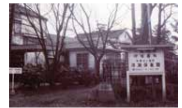
緑陰通りから見た清瀬保養園正門(昭和36年頃か)

その後、昭和45年に名称を竹丘病院と改め、地域住民の健康管理を視野に、翌46年、外来棟