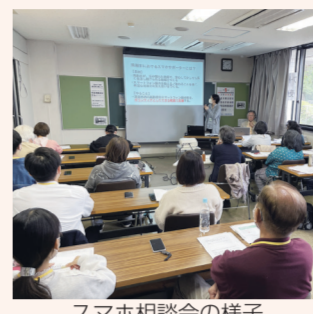
スマホ相談会の様子