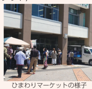
ひまわりマーケットの様子