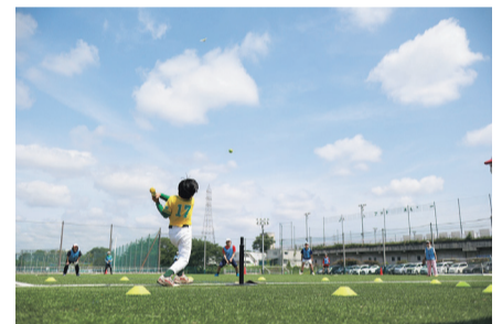
ティーボール大会