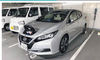
電気自動車の充電

しあわせ未来センターは令和5年5月に子育て支援施設としてリニューアルオープン! キッチンスタジオやフィットネスルームも併設し、健康増進など多世代の皆さんがご利用いただけます。また、清瀬市役所本庁舎は令和3年5月に建て替えが完了しています。なお、本庁舎1階の市民交流スペースは、午後8時まで開放しています(年末年始を除く)。お友達との談笑に使うもよし、勉強するのよし、ご自由にご利用ください!