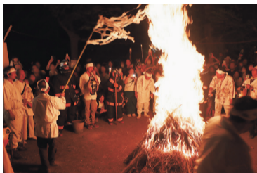
お焚き上げの様子