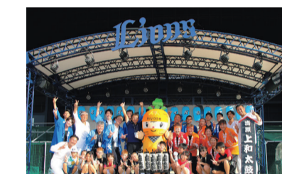
ステージでの記念撮影

今年のテーマは「祭」で、清瀬市からは清瀬上和太鼓の皆さんが参加しました。迫力ある太鼓パフォーマンスをご披露いただき、大いに盛り上がりました。また、自治体お祭りブースで