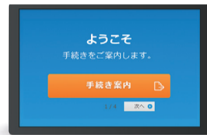
書かない窓口のイメージ