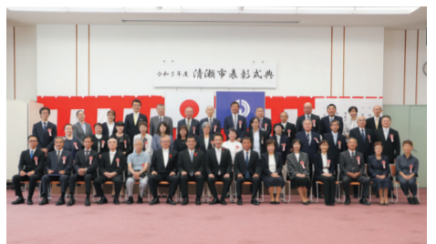
表彰された皆さん

10月3日、アミューホールで清瀬市表彰条例に基づき「市民表彰」及び「技能功労彰」の表彰を行いました。今年の表彰者は、市民表彰26人・5団体、技能功労彰7人で次の方々です(敬称略・順不同)。