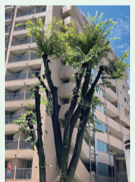
7月に職員が剪定し、ムクドリが嫌がる鳥よけのテープをぶら下げた。

また今年度、けやき通りの現状を踏まえたうえで、市民の皆さんが誇りに思えるシンボルロードとしての機能を発揮するため、けやき通りの景観やあり方を示す「けやき通りブランドデザイン」を策定し、これに基づいて今後管理等を推進していきます。☎水と緑と公園課緑政係 ☎042-497-3267