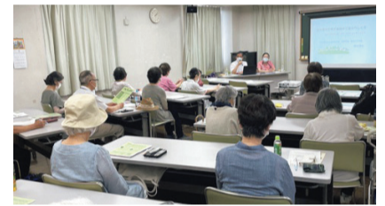
消費生活センターの講座