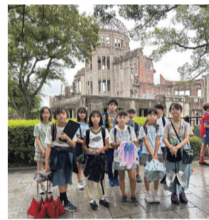
ピース・エンジェルス広島派遣