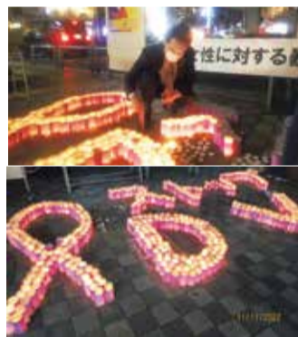
昨年の様子 (上はキャンドルを灯す瀬谷市長)

市は「女性に対する暴力をなくす運動」の目的と共に、女性に対する暴力とは何か、どのような被害が起こっており、どのような対策がなされているかなどをシリーズで掲載しています。ぜひご一読ください。