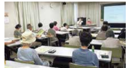
消費生活センターの講座