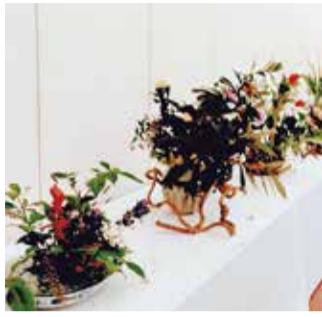
昨年の展示の様子