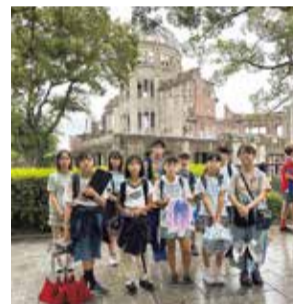
ピース・エンジェルズ広島派遣