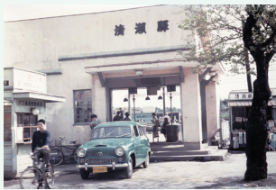
昭和28年～昭和30年代(北口)

「未来の清瀬駅」をテーマに、将来の清瀬駅への夢を膨らませます。 【応募作品、応募規定】①手描き作品のみ。未発表の自作品1点とする(複数名での合作作品は不可) ②用紙は白色の画用紙の八つ切りサイズ③水彩、クレヨン、コンテ、鉛筆、油彩など画材・表現方法は自由だが、絵画作品及び平面作品とする(写真やコンピューターグラフィックス等を使用した作品及び切り絵は不可) ④標語や清瀬駅を表す以外の文字の使用は不可⑤他に同一・類似作品がないもの、第三者の著作権、肖像権その他権利を侵害しないもの 1月16日(火)～3月15日(金)(当日消印有効)に応募票に必要事項を記入し、作品裏へ貼り付けて直接窓口または郵送で郷土博物館へ