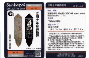
しあわせ未来センターカード(左)、月待板碑カード(上)