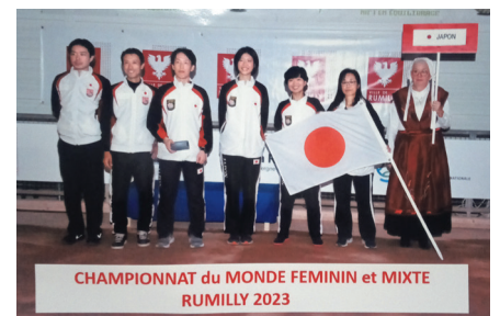
熊野さん(左から2番目)と日本代表チームの皆さん

スポールボールはフランス発祥で世界最古の球技と言われています。鉄製のボールを転がし