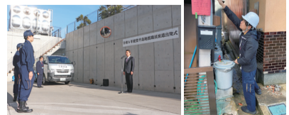
第二陣の出発式と現地での活動の様子