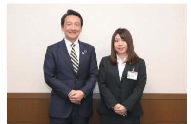
迫さん(右)と澁谷市長