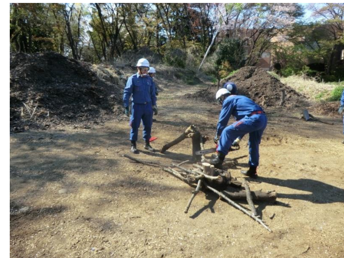
チェーンソー訓練の様子