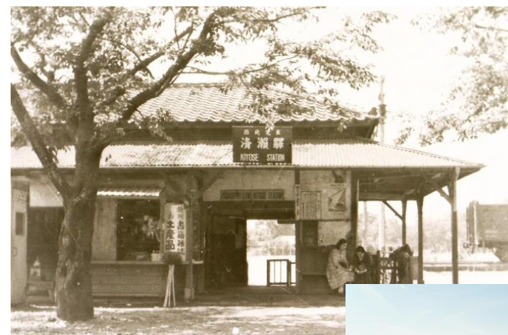
上:初代清瀬駅 (昭和25年撮影) 右:現在の清瀬駅 (令和5年撮影)