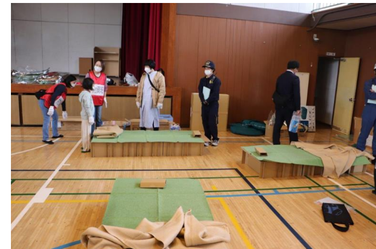
避難所訓練の様子