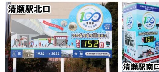
カウントダウンボードを設置